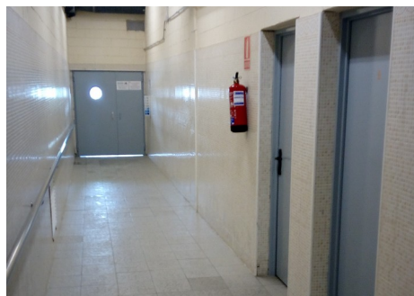
Passadís d'accés a la piscina interior