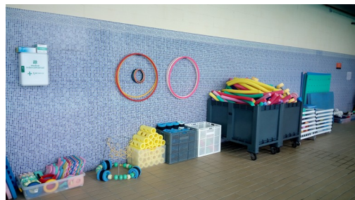
Material didàctic d'ensenyament-aprenentatge