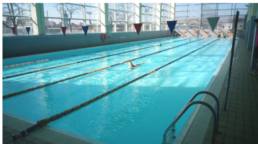
Piscina de 33mts amb 5 carrils Fondària: 1m – 1.50m – 1.30m